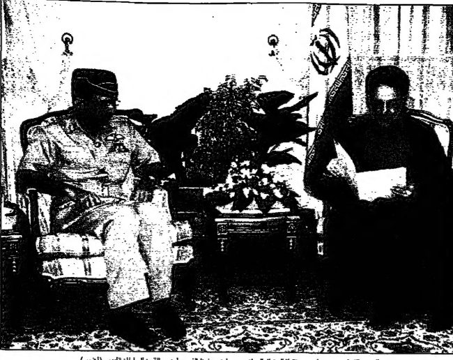
الرئيس الإيراني محمد خاتمي مستقبلاً الجنرال محمد علي عثمان في سفارة في القاهرة

القاهرة 6 آب - في خطوة جديدة في تعزيز العلاقات الإنسانية بين السودان والولايات المتحدة، فقد وافقت الحكومة السودانية على إنشاء جسر جوي لنقل معونات إماراتية إلى جنوب السودان. وقال مسؤول حكومي، إن الجسر الجوي سيستخدم لنقل المساعدات الإنسانية من الإمارات إلى جنوب السودان. وقال مسؤول حكومي، إن الجسر الجوي سيستخدم لنقل المساعدات الإنسانية من الإمارات إلى جنوب السودان.